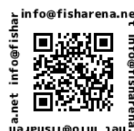
フィッシャリーナメール