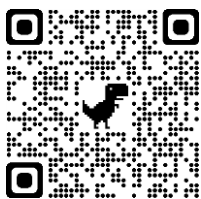
糸満フィッシャリーナ HP